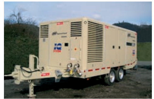
25/330 Kompressor auf StVZO Tandemfahrwerk, Ausgestattet mit Optionalem IQ System.